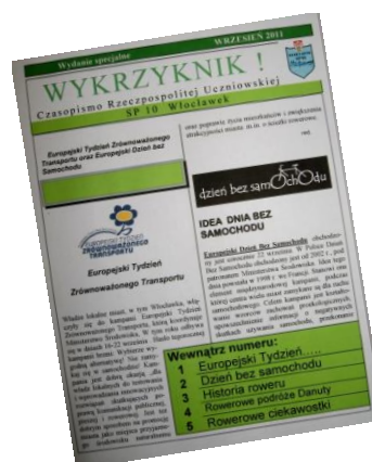
Nasze -specjalne wydanie „Wykrzyknika”