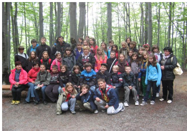
W Leśnym Parku Niespodzianek