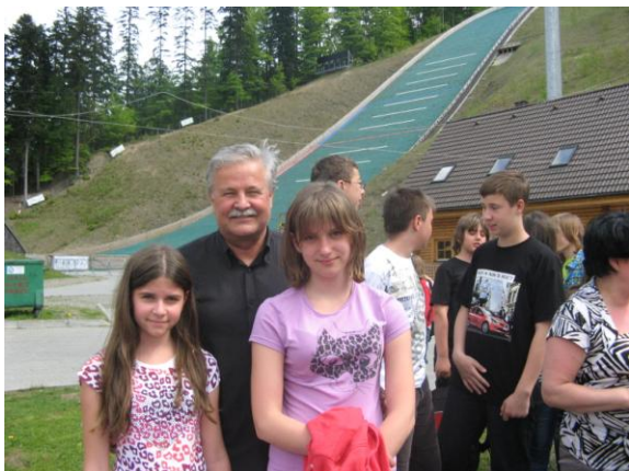
Przed skocznią narciarską Malinka

śnie - na Słowacji, w Czechach i Polsce. A było to w miejscowości Jaworzynka. W ostatnim dniu uczniowie mieli możliwość poznać najciekawsze obiekty świata i Polski w Parku Miniatur w Inwałdzie.