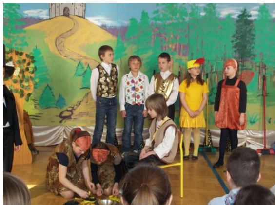
Uczniowie podczas tańca ze szczotkami