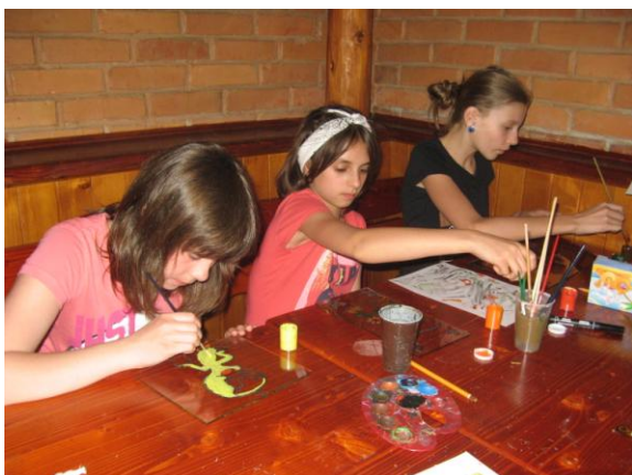
Malowaliśmy na szkle

Podczas „zielonej szkoły” odbyły się 2 dyskoteki, warsztaty – malowanie na szkle oraz ognisko. Zwiedzając polskie i słowackie góry wszyscy mieli okazję zapoznać się przyrodą, z życiem sów i ptaków drapieżnych, z tradycjami i codziennym życiem mieszkańców Beskidu Żywieckiego i Śląskiego.